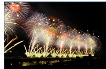
長岡花火イメージ

★その他の事項については、当社旅行業約款によります。 ※運轉機関・天候の都合で行程内容、時間が変わる場合があります。 ※天候・気温に応じて花の開花状況および果物の生り状況が変わる場合もございます。 ※朝食が付く場合はおにぎり弁当となります。 ※特に記載のない場合を除き添乗員が同行いたします。 ※バス内は禁煙となります。 ※乗車人員は各回40名(最少催行人員20名)となります。(ツアーコース案内に記載の場合は除く※バスの運行は城南観光バスまたは他社バスとなります。