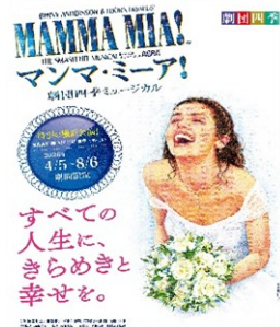
ABBAのヒット曲で知る世界が楽しめたミュージカル

城南観光 7 : 00 発 = 古代蓮の里 (観光) = 妻沼聖天山歓喜院 (参拝・周辺自由観光・西田園などの雪くまもぜひご賞味ください) = 城南観光 12 : 00 頃 ※帰りにお土産のお寿司をお渡しします