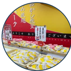
詰め放題イメージ

城南観光 9:00発 = 熊谷さくら運動公園 = <高速道> = 佐野プレミアムアウトレット(自由昼食・買い物) = 蛸屋おかしパーク(みかもの月詰め放題・お菓子作り体験) = <高速道> = 熊谷さくら運動公園 16:30頃 = 城南観光 17:00頃