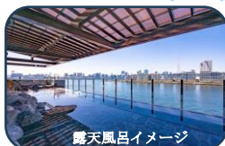
露天風呂イメージ

城南観光 8:30頃発 = <高速道> = 北里柴三郎記念館(観光) = 豊洲千客万来 万葉倶楽部(昼食・バイキング・入浴) 豊洲市場から仕入れた生本まぐろをはじめとしたバイキング、景色抜群の露天風呂などお楽しみください) = 旧渋沢庭園(観光) = <高速道> = 城南観光 17:00頃