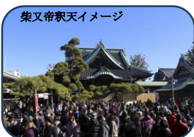
柴又帝釈天イメージ