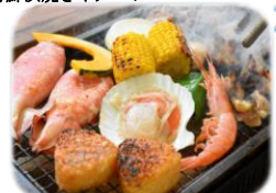
海鮮浜焼きイメージ