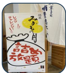
おかしパークイメージ